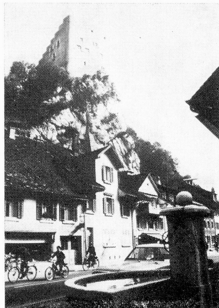
Castillo de Alt-Falkenstein, siglo 13

"Mit Lütli uff em Bärge deheim... canta Josef Reinhart en una de sus canciones. ¡Cómo pasa el tiempo! Antaño podían oírse en las alturas del Jura, o abajo en los valles, las canciones bucólicas del cantor ciego