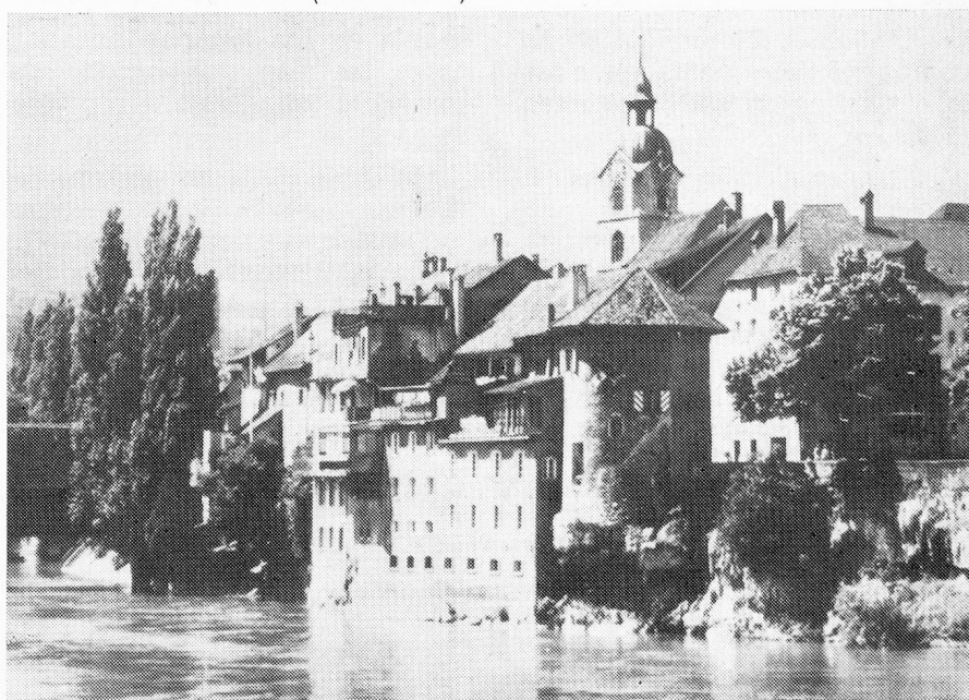
Olten a orillas del Aar

¿Es Solothurn un cantón jurasiano? Sin duda, pero no olvidemos que un tercio de su territorio se extiende sobre la planicie mediterránea suiza. Una extensa llanura. El valle del Aar con algunas quebradas laterales que conducen detrás de la cadena del Jura. Quien llegue desde