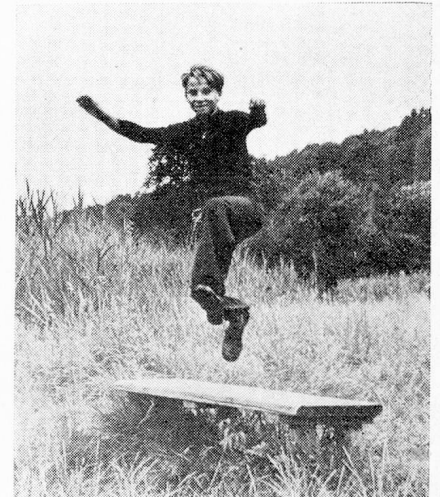
No conoce obstáculos

Mayores informes: pueden solicitarse en su Consulado de Suiza. Deseamos desde ya a sus niños unas hermosas vacaciones suizas y les saludamos muy cordialmente, Pro Juventute Sección Niños Suizos del extranjero Seefeldstrasse 8, CH-8022 Zürich