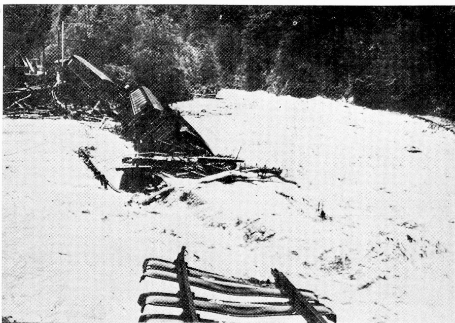
Accidente ferroviario cerca de Davos.

El Comité de iniciativa de Berthoud deposita en Berna su ini-