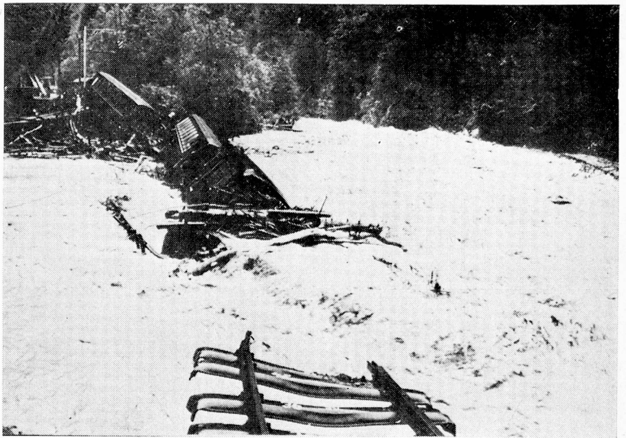
Accidente ferroviario cerca de Davos.

El Comité de iniciativa de Berthoud deposita en Berna su ini-