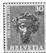
Cabeza de una estatua de Baco