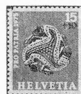
Broche de oro