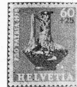
Garrafa de vidrio

Servicio filatélico DG PTT, CH-3000 Berna