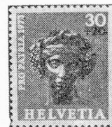
Cabeza de una estatuita de Baco