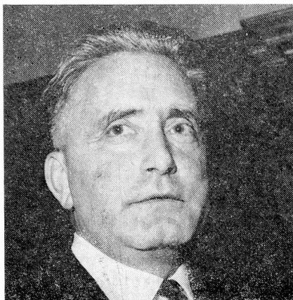
Consejero Federal Sr. G. A. Chevallaz.

tencia médica un "seguro de estadía". Las condiciones pueden solicitarse directamente a las cajas de asistencia médica suizas.