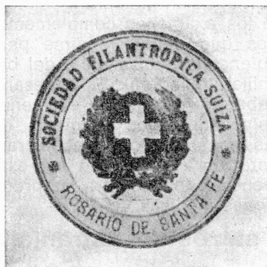
Primer sello de la Sociedad Filantrópica Suiza de Rosario

No es fácil historiar en breves palabras el desarrollo y la centenaria vida de esta Sociedad Filantrópica Suiza. Para ello hay que retroceder en el tiempo y ubicarse en una época que nos cuesta recordar.