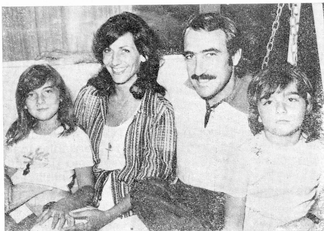
...en rueda familiar