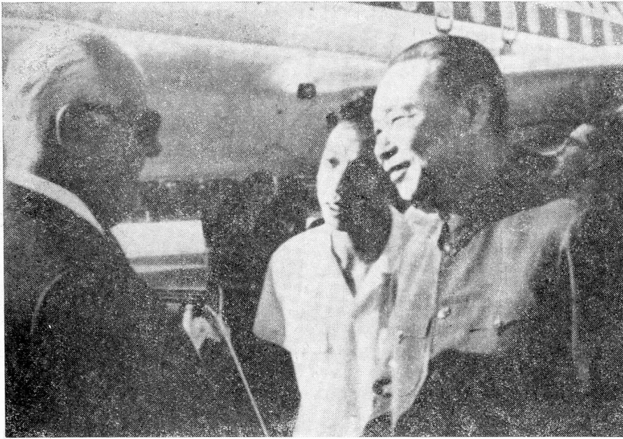
El Consejero federal Graber recibido en Pekín por su colega chino Tschì Peng Fei.