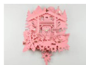
Eine Kuckucksuhr von Swiss Koo