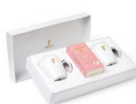
So gut kann Tee sein: Tee-Set von Sirocco