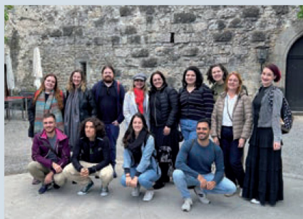
Professores participantes do job shadowing

Job shadowing é um termo da língua inglesa usado para descrever uma prática comum em muitos países que permite a um estudante universitário ou profissional explorar determinados aspectos de seu campo de trabalho. A ideia é que a pessoa acompanhe o dia a dia de outro profissional, como se fosse uma sombra [shadow].