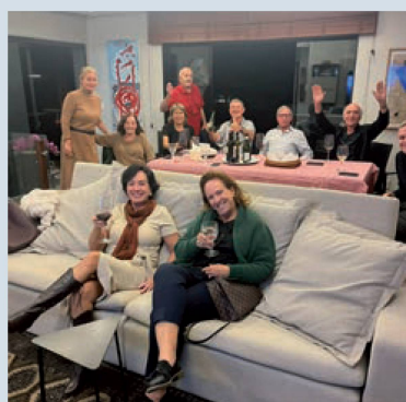
Comemoração do Dia Nacional da Suíça