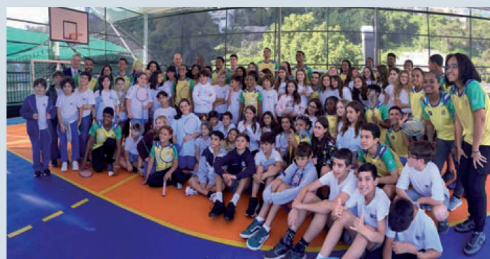
Alunos da escola SIS junto com atletas da Associação Miratus

Inauguração da nova quadra esportiva na Escola Suíça com a participação da Miratus de Badminton