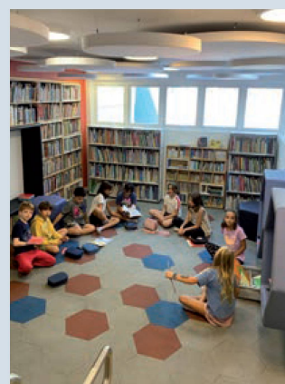
Crianças na biblioteca

No 4º e no 5º ano, a habilidade leitora é desenvolvida na roda de leitura, momento em que cada aluno compartilha