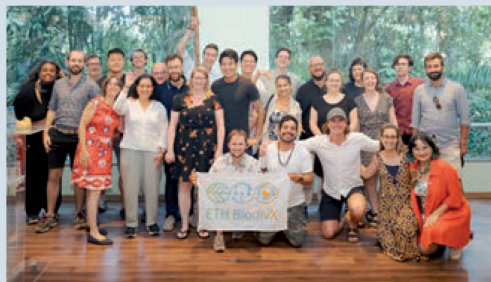
Grupo ETH BiodivX no palco do evento celebrando o final da competição

BiodivX, apresenta a exposição “Amazônia Mapeada: Imagens e Sons do DNA Ambiental.” Este projeto inovador une ciência, cultura e arte para destacar a urgência de preservar a biodiversidade e mitigar as mudanças climáticas.