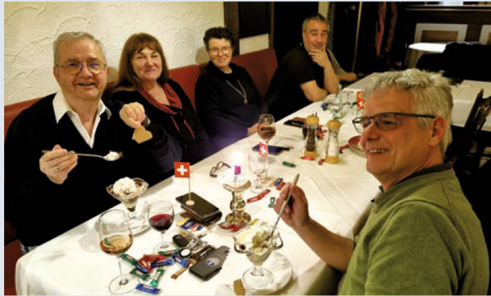
Eine Glace rundet das Mahl bei den Landsleuten im Ruhrpott ab.

Dürfen wir vorstellen: Der Schweizer Verein für Essen (Ruhr)