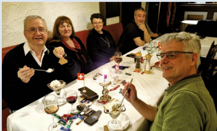
Eine Glace rundet das Mahl bei den Landsleuten im Ruhrpott ab.

Dürfen wir vorstellen: Der Schweizer Verein für Essen (Ruhr)