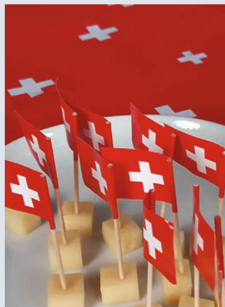
Die 100.000er-Marke ist vermutlich schon geknackt: Schweizer und Schweizerinnen, die in Deutschland leben