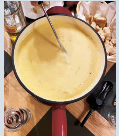
Fondue im Alpenhotel Vögeli, Malbun