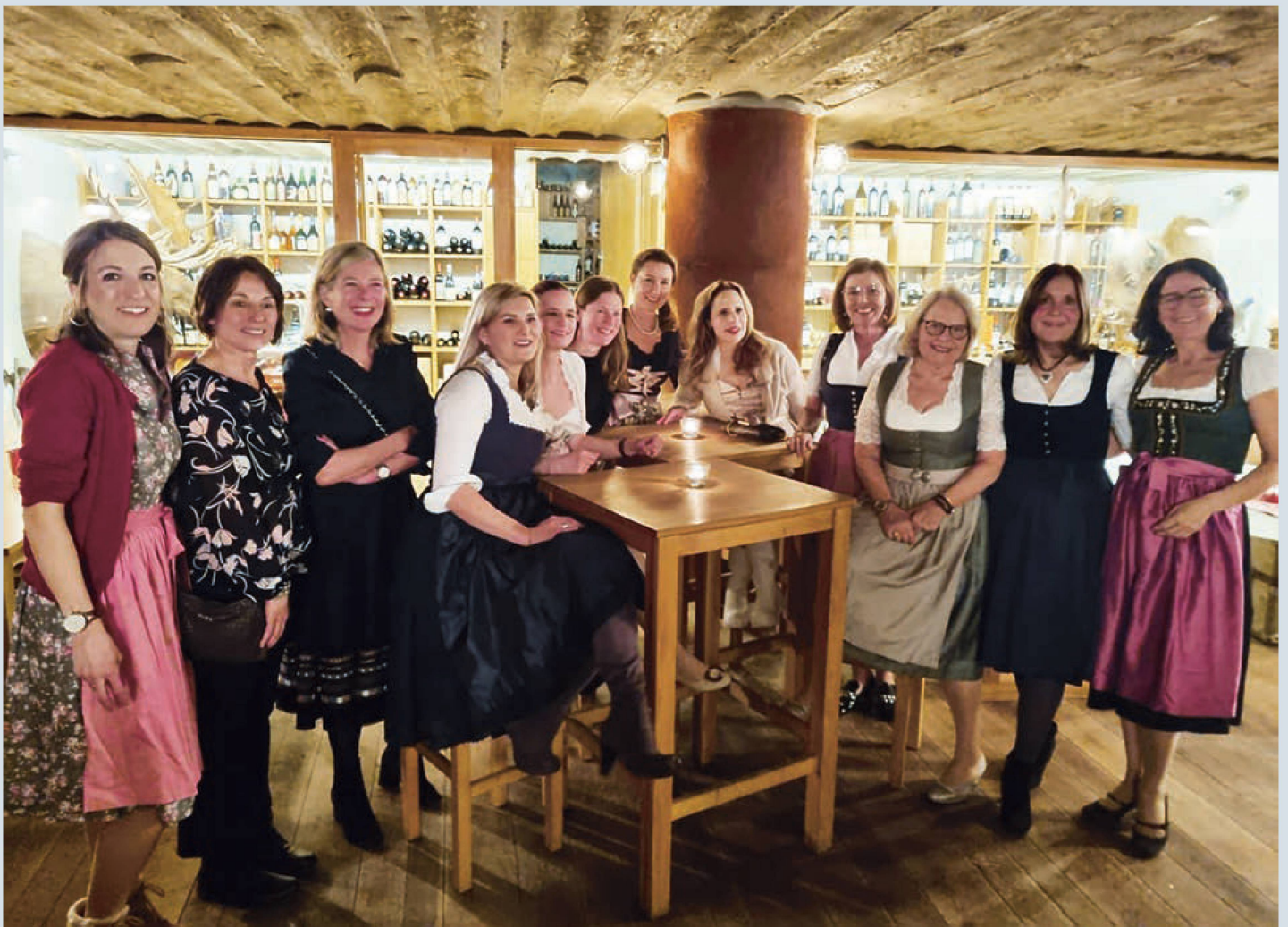
Fesche Mädels im Dirndl