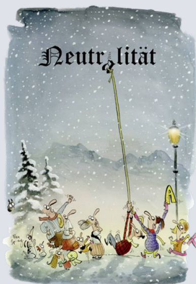
Das Ringen um die «richtige» Neutralität.

Der Auslandschweizerrat bezieht nicht nur Position. Er richtet auch Forderungen an die Landesregierung. Er verlangt vom Bundesrat, «eine Politik der strikten mili-