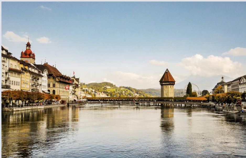
Eines der bekanntesten Wahrzeichen Luzerns: die Kapellbrücke mit dem Wasserturm.

Der 100. Auslandschweizer-Kongress wird vor einer herrlichen Kulisse stattfinden: in Luzern am Vierwaldstättersee, mit dem majestätischen Alpenpanorama im Hintergrund. Vor allem aber werden wir am Kongress drei Jubiläen feiern und einen bereichernden Gedankenaustausch pflegen.