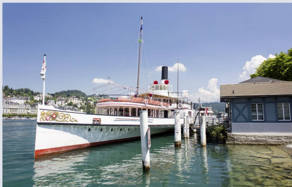
Schiffe gehören zu Luzern: das historische Dampfschiff «Uri» am Bahnhofquai Luzern

kehren und wollten ihr Glück anderswo suchen. Heute erleben wir eine dynamischere, aber auch kürzer andauernde internationale Mobilität, oft motiviert durch berufliche Chancen oder den Wunsch nach einem friedlichen Ruhestand im Ausland.