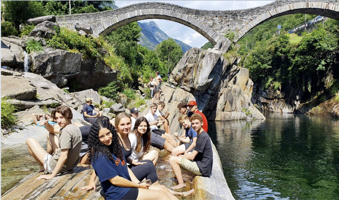
Eine römische Brücke über den wilden Fluss Verzasca, eine tolle Natur- und Kulturlandschaft und neue Freundschaften: Hier kommt alles zusammen, was bleibende Erinnerungen schafft.