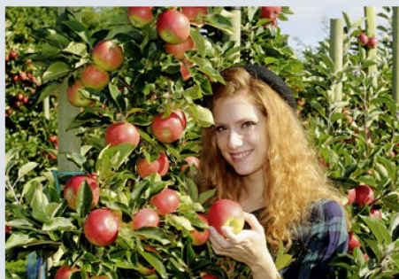
Eine enorme Bandbreite prägt die 245 Berufe, für die in der Schweiz Lehren angeboten werden – von Obstfachfrau und Obstfachmann ...

Eine Berufslehre dauert je nach Beruf drei oder vier Jahre. Mit dem Abschlussdiplom, dem Eidgenössischen Fähigkeitszeugnis EFZ,