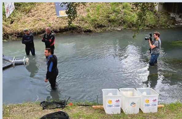
Spannung beim Zieleingang

Um 17.30 Uhr kippte dann ein Bagger am Sandhüslerweg in Triesen die 3000 Plastikenten in den Kanal. Die Rennenten waren dieses Jahr in normalem Tempo unterwegs und die erste Ente erreichte nach 25 Minuten das Ziel. Wiederum fieberten etliche Besucher sowohl beim spektakulären Einkippen der Entchen als auch beim Zieleingang mit und hofften auf einen der vielen schönen Preise für die 25 schnellsten Rennenten. Der erste Preis, einen Reisegutschein in Höhe von CHF 1000.00 des Reisebüro Traveller AG, Vaduz, ging an die