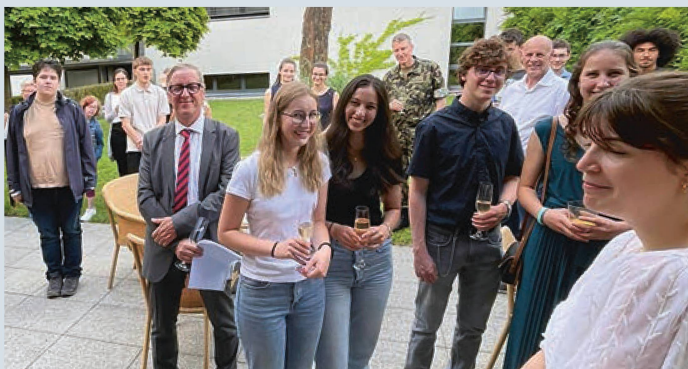
Jungbürgerfeier vom 23. Juni 2023 im Hotel Schatzmann / Restaurant Vivid