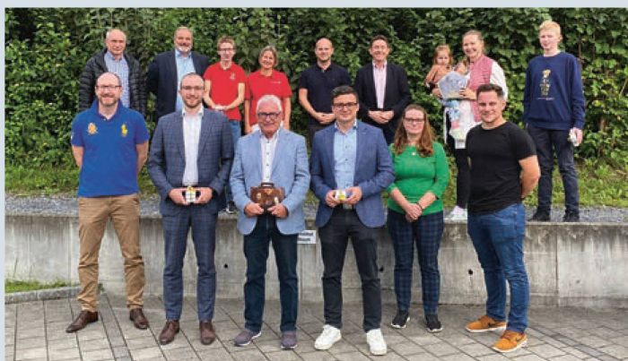
Die Preisübergabe für das Entenrennen fand am 30.08.2023 im LoBistro statt