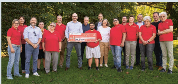
Scheckübergabe an Special Olympics Liechtenstein am 26.09.2023

Besten Dank für die grossartige Organisation und allen zahlreichen freiwilligen Unterstützern für die wertvolle Mithilfe!