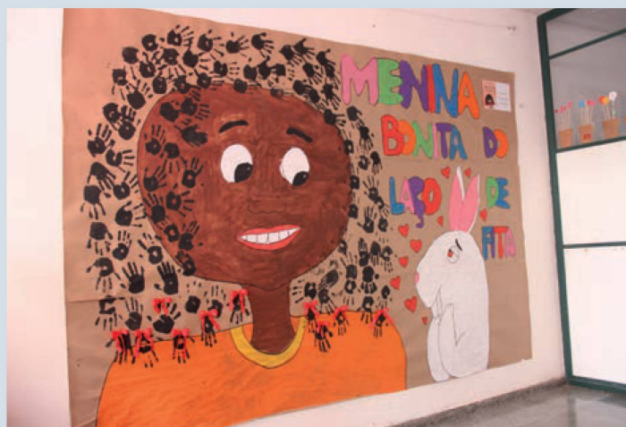
Pintura a óleo sobre tela

Enquanto disciplina escolar de formação, entende-se que uma das missões das aulas de Arte, além de desenvolver habilidades técnicas ou manuais, é também colaborar para que os alunos ampliem sua visão sobre a arte na história e seu papel na construção de cada um enquanto ser humano.