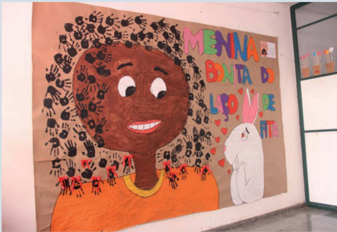
Pintura a óleo sobre tela

Enquanto disciplina escolar de formação, entende-se que uma das missões das aulas de Arte, além de desenvolver habilidades técnicas ou manuais, é também colaborar para que os alunos ampliem sua visão sobre a arte na história e seu papel na construção de cada um enquanto ser humano.