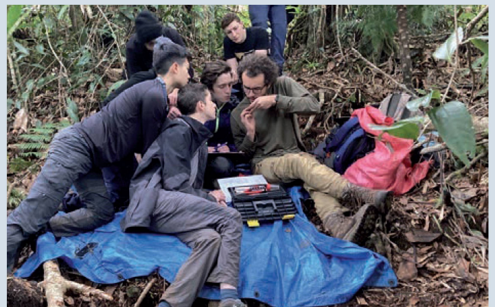
Coletando dados no Parque Nacional Cusuco

Nós passamos duas semanas em Honduras. Na primeira, ficamos no Parque Nacional Cusuco, uma floresta de altitude linda, mas um tanto peculiar para nós, brasileiros. Ao mesmo tempo em que é uma mata tropical, com toda uma diversidade muito parecida com a que temos aqui na Amazônia ou na Mata Atlântica, é uma mata cheia de pinheiros remanescentes da última glaciação. É uma floresta tropical