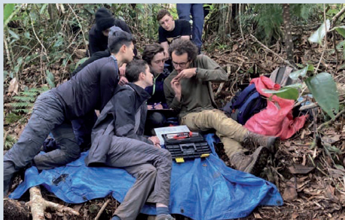
Coletando dados no Parque Nacional Cusuco

Nós passamos duas semanas em Honduras. Na primeira, ficamos no Parque Nacional Cusuco, uma floresta de altitude linda, mas um tanto peculiar para nós, brasileiros. Ao mesmo tempo em que é uma mata tropical, com toda uma diversidade muito parecida com a que temos aqui na Amazônia ou na Mata Atlântica, é uma mata cheia de pinheiros remanescentes da última glaciação. É uma floresta tropical