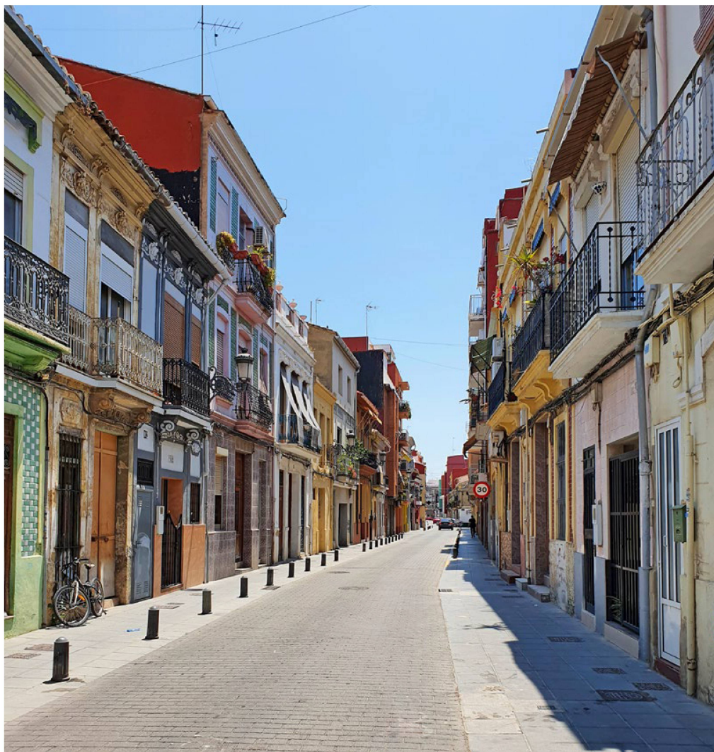
Die Umfrage zeigt: Die Kulisse des Alltags mag mediterran sein, doch die Bindung zur Schweiz bleibt gleichwohl stark.

Die Fünfte Schweiz rund ums Rentenalter besteht aus Personen mit mehreren Nationalitäten, die regelmässig in andere Länder der Welt reisen. Die meisten dieser Personen sind bereits ein- oder mehrere Male migriert, le-