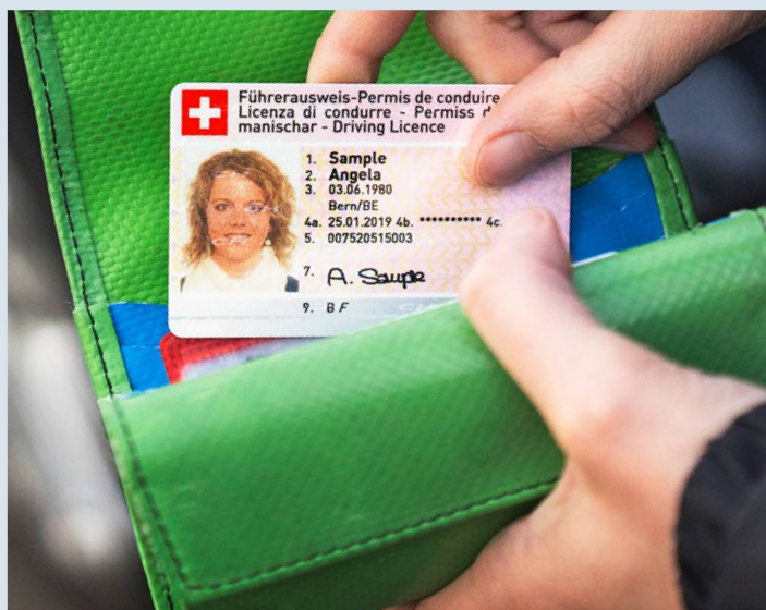
Den Führerausweis gibts in der Schweiz nur noch im Kreditkartenformat.

Die Frage: Seit vielen Jahren lebe ich im Ausland – ausserhalb des EU/EFTA-Raumes – und habe nun erfahren, dass der blaue Schweizer Führerausweis aus Papier nach dem 31. Januar 2024 nicht mehr gültig sein wird und umgetauscht werden muss in einen Ausweis in Kreditkartenformat. Weder das Schweizer Konsulat noch das angefragte Strassenverkehrsamt in der Schweiz konnten mir weiterhelfen. Auslandschweizer:innen müssen doch auch eine Möglichkeit haben, ihren alten Schweizer Führerausweis nicht zu verlieren. Was kann ich unternehmen?