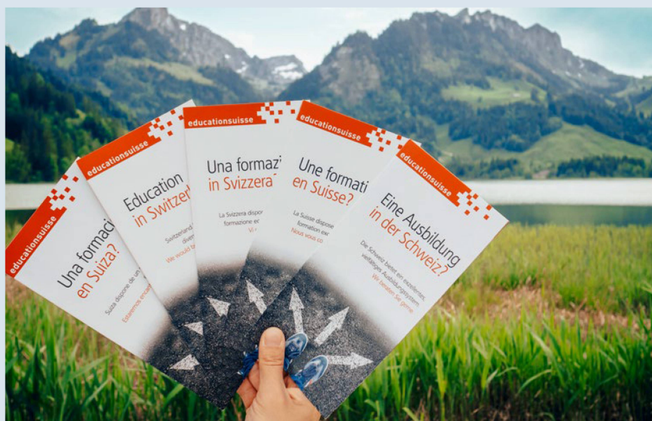
Informationsmaterialien zur Ausbildung in der Schweiz sind in etlichen Sprachen erhältlich.