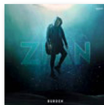
ZIAN: «Burden». Sony, 2022.

Er kam aus dem Nichts und legte über Nacht einen der grössten Schweizer Hits des letzten Jahres vor. Der Song hiess «Show You», der Sänger nennt sich Zian. Doch wer ist dieser Newcomer, von dem zuvor niemand gehört hatte?