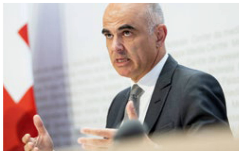
Gesundheitsminister Alain Berset wertet das deutliche Ja als Zeichen der Wertschätzung und des Dankes ans Pflegepersonal.