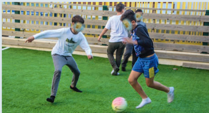
Spiel und Spass in der Sportanlage des Kinderhauses im Stadtviertel Gilo. Aus Gründen des Persönlichkeitsschutzes sind die Gesichter der Kinder auf dem Bild unkenntlich gemacht.

Das Café-Europa-Programm für Shoa-Überlebende wird ebenfalls aus der Schweiz gefördert. In Jerusalem leben über 10 000 Holocaust-Überlebende. Vereinsamung ist im Alter bekanntlich ein allgemeines Problem, bei diesen Menschen kommen jedoch die schrecklichen Erinnerungen aus der Kindheit hinzu. Die sechs Café-Europa-Lokalitäten gehen auf die Bedürfnisse der jeweiligen Stadtviertel