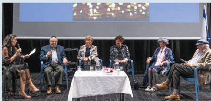
Aktiver Austausch und Unterstützung im Alter: Café-Europa-Programme werden von Shoa-Überlebenden sehr geschätzt.

ein und die Sozialarbeiterinnen besuchen jene zu Hause, die nicht an den wöchentlich stattfindenden kulturellen Programmen teilnehmen können.