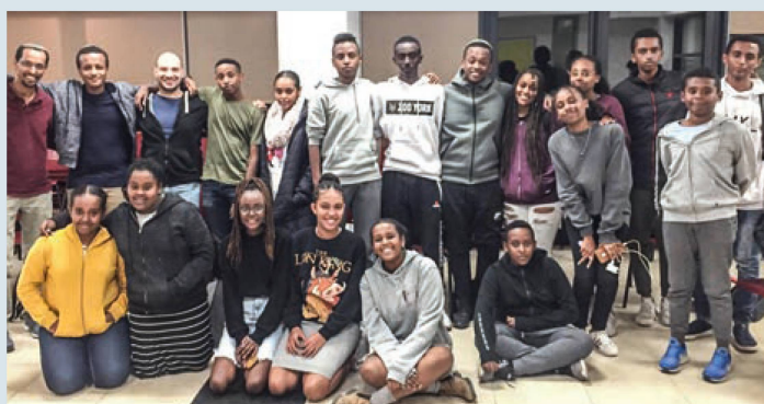
Der Grundstein für eine erfolgreiche Zukunft: Schülerinnen und Schüler aus Familien, die aus Äthiopien eingewandert sind, können von Förderprogrammen profitieren.