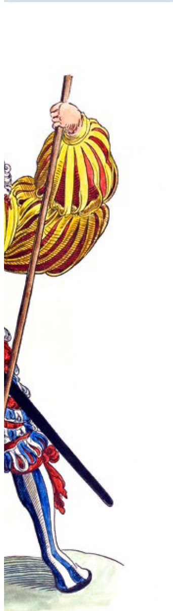
Blutiges Handwerk in prächtiger Kleidung: Der Söldner Gall von Untervalden. Kolorierter Holzschnitt aus der Zeit um 1520–1530.

auch künftig Kanonen «Swiss made» bestellen kann, hängt davon ab, wie der Bundesrat bei neuen Exportgesuchen die Menschenrechtslage im Land beurteilen wird. An kriegesischen Auseinandersetzungen wie in Jemen ist Katar derzeit nicht beteiligt. Gemäss Nahostexperten ist der reiche Wüstenstaat am Persischen Golf aber bestrebt, eine Regionalmacht zu werden. Dies erhöht die Gefahr, in künftige Konflikte verwickelt zu werden, die wiederum Verletzungen des humanitären Völkerrechts zur Folge haben können. Daran kann die Schweiz als Depositärstaat der Genfer Konventionen eigentlich kein Interesse haben.