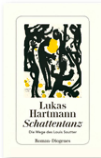
LUKAS HARTMANN: «Schattentanz» Diogenes Verlag AG Zürich, 2021 256 Seiten; CHF 32.00

«Ich glaube, es war 1927, als ich das erste Mal zu ihm nach Ballaigues fuhr, zu meinem Cousin ...». Wer ist dieser Cousin des berühmten Architekten Le Corbusier? Louis Soutter heisst er, ist zu Lebzeiten als Maler verkannt und wird erst viel später einem breiteren Publikum bekannt. Geboren wurde Louis Soutter 1871 in einer Apothekerfamilie in Morges am Genfersee. Die gefühlskalte Mutter erzieht Louis und seine Geschwister äusserst streng. Louis muss Geige spielen und erhält eine vorzügliche musikalische Ausbildung. Er heiratet nach Amerika, kehrt aber einige Jahre später verstört und abgebrannt in die Schweiz zurück. Es gelingt ihm nicht, wieder Fuss zu