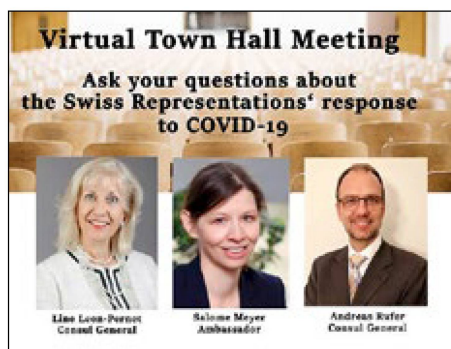
Die Technik macht's möglich: Ottawa, Montreal und Vancouver waren am «Townhall-Meeting» gleichzeitig präsent.

Die Corona-Pandemie hat unsere Bewegungsfreiheit stark eingeschränkt. Sie hat aber unseren Horizont auch erweitert. So bietet es sich angesichts der globalen Dimension der Krise an, bei der Suche nach guten Ideen für die konsularische Arbeit über den eigenen Tellerrand hinauszublicken. Zur Nachahmung inspiriert haben uns in Kanada