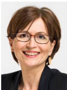
Nationalrätin Regula Rytz: «Ein Versuch, die Wissenschaft als Überbringerin von schlechten Nachrichten zum Schweigen zu bringen.»