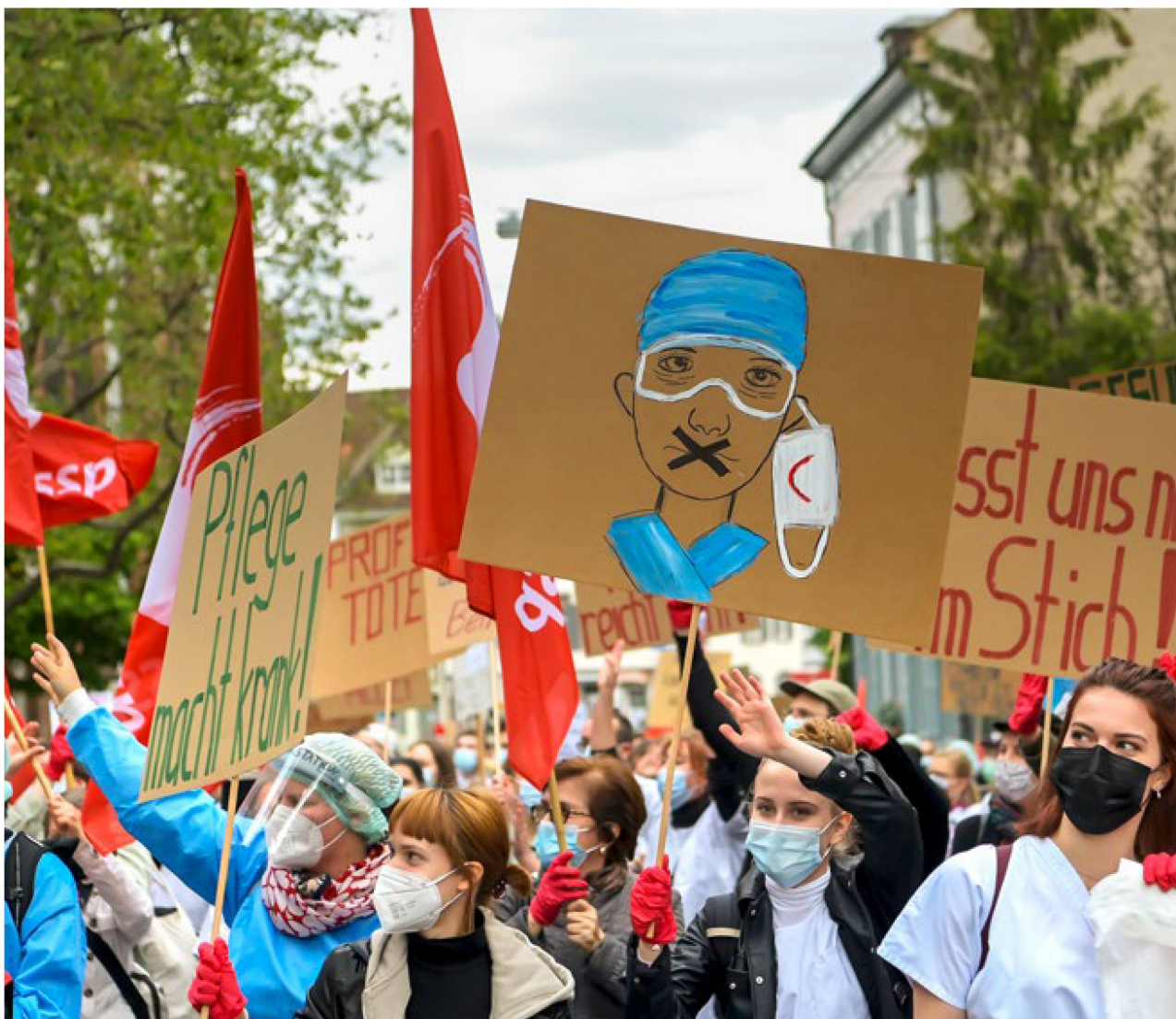
«Pflege macht krank»: Parolen wie diese trug das Gesundheitspersonal am 12. Mai 2021 durch Basels Strassen. Solche Proteste waren schon vor der Corona-Pandemie ein regelmässig wiederkehrendes Bild.