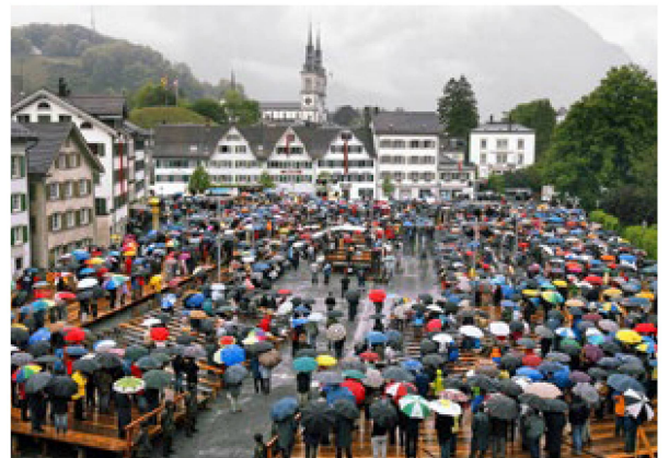
Die Glarner Landsgemeinde ist eine archaische Urform der direkten Demokratie: Am regnerischen 6. Mai 2007 entschied sie sich für die Moderne und gewährte den 16-Jährigen das Stimmrecht.

1971 führte die Schweiz nach langem Kampf das Frauenstimmrecht ein, 1991 senkte sie das Stimmrechtsalter