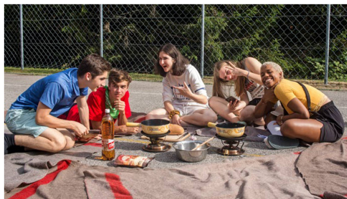
Damals noch ohne Maske und Distanzregeln: Lockere Fondue-Szene während des Sport- und Freizeitlagers 2019 in St.-Croix.

Angesichts der weltweiten Corona-Pandemie hatte die Auslandschweizer-Organisation die schwierige Entscheidung zu treffen, 2021 weniger Lager als ursprünglich geplant durchzuführen. Organisiert werden nun zwei Lager, eines in den Waadtlanden, das andere in den Walliser Alpen. Das Sommerlager findet vom 10. bis 23. Juli 2021 in Château-d'Œx statt, das Winterlager vom 27. Dezember 2021 bis 5. Januar 2022 in Grächen. Selbstverständlich wird die weitere Entwicklung der Pandemielage genau verfolgt: Veränderungen, die sich auf die Lager auswirken, werden laufend auf der Website www.swisscommunity.org veröffentlicht.