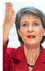
Bundespräsidentin Simonetta Sommaruga.