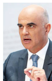
Gesundheitsminister Alain Berset: Eigener Weg gesucht.