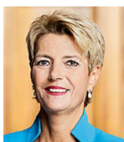
Justizministerin Karin Keller-Sutter: Rein staatliche Lösungen sind nicht optimal.