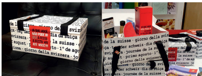
Brinde cheio de lembranças da Suíça

Foi mais um primeiro de agosto que não pôde ser comemorado como gostaríamos. Mesmo assim, o Consulado geral da Suíça no Rio de Janeiro quis se conectar com a comunidade suíça no Rio de Janeiro, pelo menos virtualmente, para que a data não passasse em branco. Por este motivo, lançamos um concurso cultural. Os participantes tinham que enviar uma foto sua relacionada à Suíça e responder à pergunta: como é uma comemoração ideal de 1º de agosto para você? Os primeiros 200 suíços que cumpriram essas duas regrinhas ganharam uma lembrança especial swissness para comemorar o 1º de agosto em grande estilo e com todo o cuidado que merecem! Recebemos muitas fotos lindas e mensagens interessantes e divertidas. Agradecemos a todos os participantes!