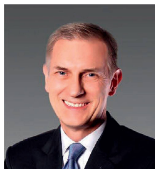
Cônsul geral no Rio de Janeiro