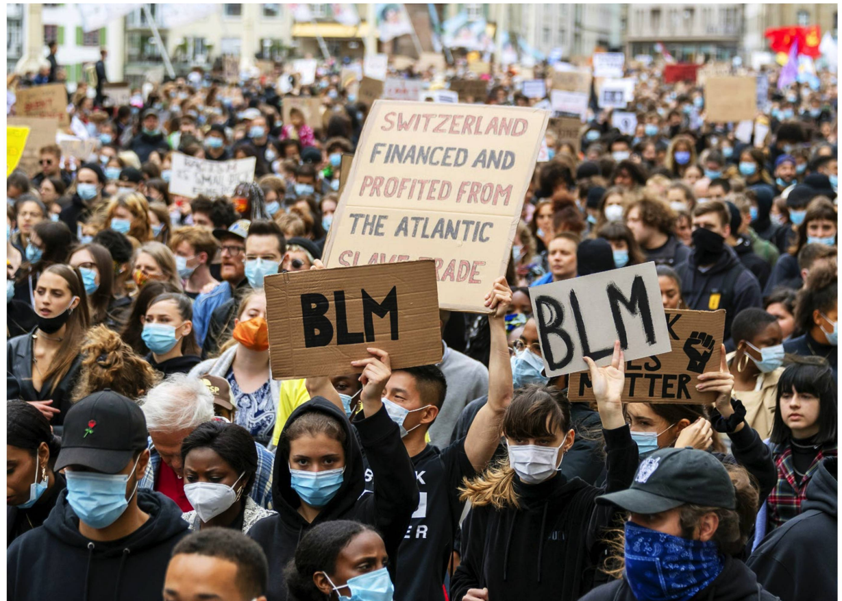
Ungeachtet der Corona-Restriktionen demonstrierten in Basel Anfang Juni 2020 Tausende gegen Rassismus.

Historische Objekte, an denen man sich in der Schweiz mit antirassistischem Furor empören kann, gibt es zuhauf. Etwa in Form von Denkmälern für Schweizer Wirtschaftspioniere und Wissenschaftler, deren Verstrickungen in die koloniale Ausbeutungspraxis man lange nicht wahrhaben wollte. Der Westschweizer Händler David de Pury, der im 18. Jahrhundert am portugiesischen Hof auch dank Sklavenhandels zu Reichtum kam und diesen der Stadt Neuenburg vermachte, wird daselbst mit einer Bronzestatue geehrt. Kritiker überschütteten sie nach den «Black Lives Matters»-Protesten mit blutroter Farbe und forderten in einer Petition ihre Entfernung.