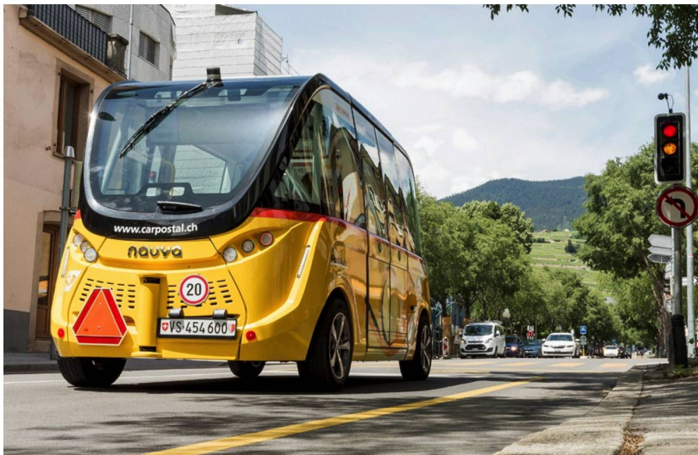
Die Befürworter des 5G-Standards sehen die Technologie auch als Schlüsselement für selbstfahrende Fahrzeuge. Im Bild ein Testfahrzeug der Post in Sitten.