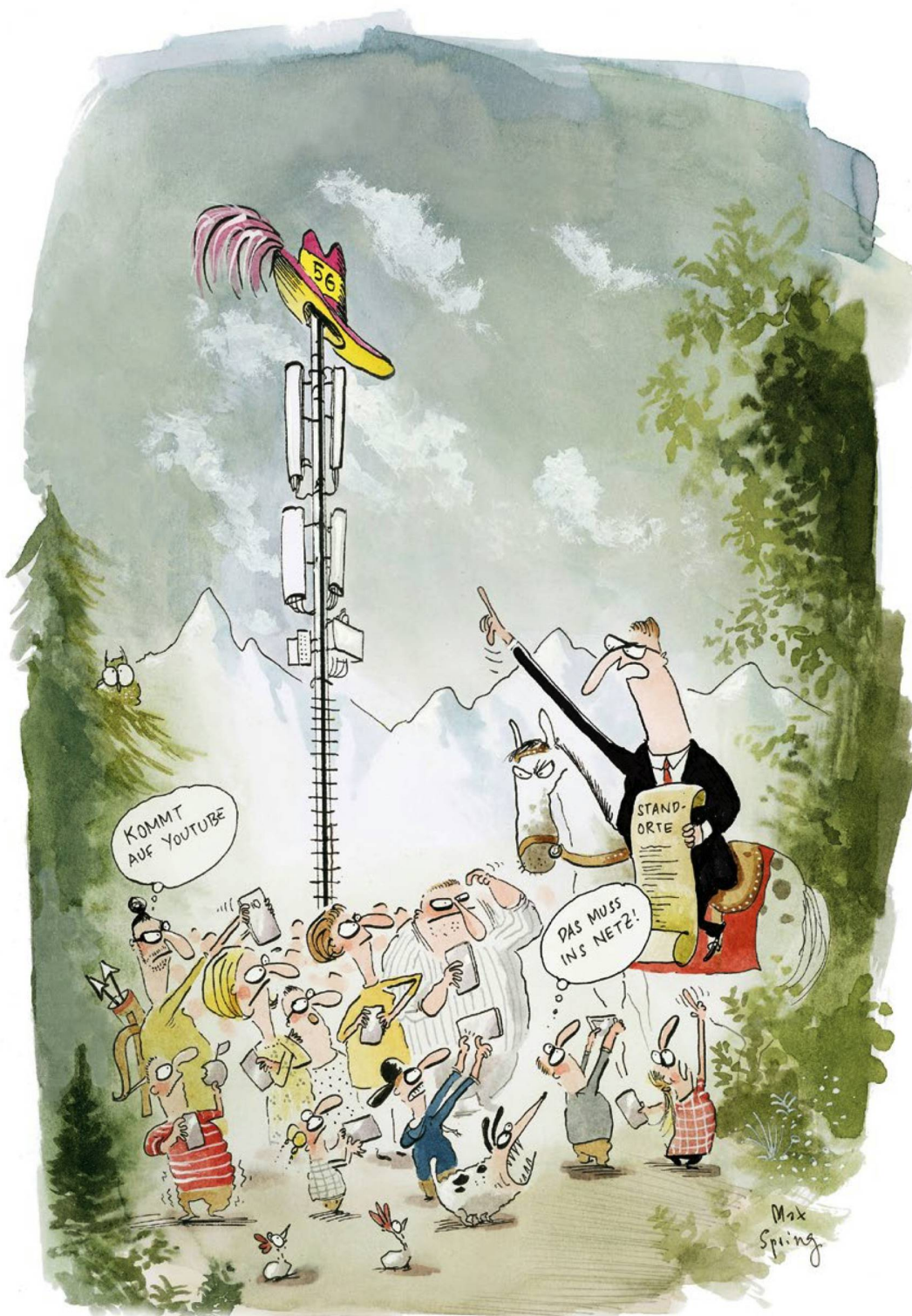
Max Spring zeichnet für die «Schweizer Revue».

Zugleich soll 5G in der Schweiz die Innovation beflügeln. Dank dem ultraschnellen Datenfluss durch die Luft