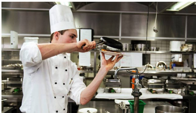
Die Welt erkunden als Schweizer Koch: Wer im Ausland arbeitet, sollte es mit der Vorsorge genau nehmen.

Nicht weiterführen kann Frau B die obligatorische Versicherung aber, sollte sie während der Zeit in China eine Arbeit bei einem Arbeitgeber mit