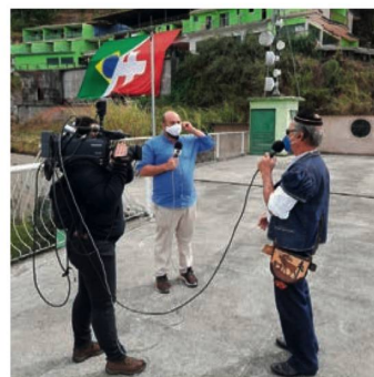
Entrevista à distância

A antiga Fazenda do Morro Queimado enfeitada de vermelho e branco