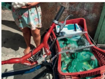
Entrega de bicicleta

Fortaleza: O projeto "EiBudega" é um grande sucesso em Fortaleza