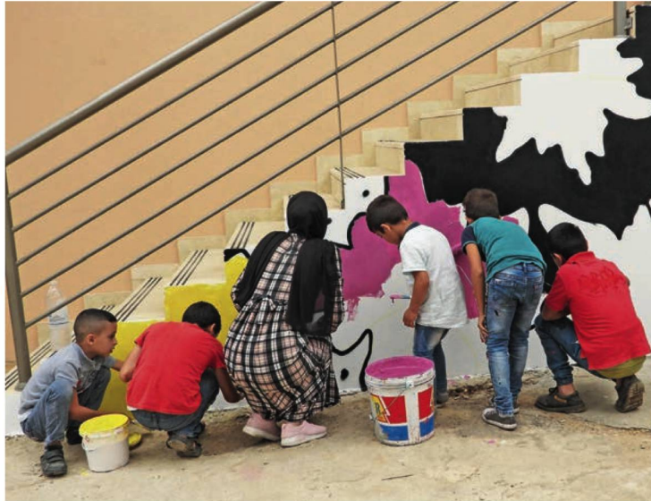
More colours: The Houara Public School allowed the kids to help decorate their school.

Each school is comprehensively assessed and rehabilitated according to its specific needs. This includes the construction of additional classrooms, playgrounds, covered passages, sanitation units and septic tanks; the repair of infrastructure, water proofing electrical systems and safety components; as