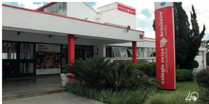
Entrada do colégio