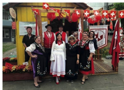
Grupo com trajes suíços

Com o lema DAS ORIGENS AO SONHO, a Prefeitura de Carlos Barbosa, através da Secretaria de Turismo, projetou uma casinha e a colocou bem no coração da cidade, no Parque da Estação. Foi nesta bela casa onde, a cada sábado