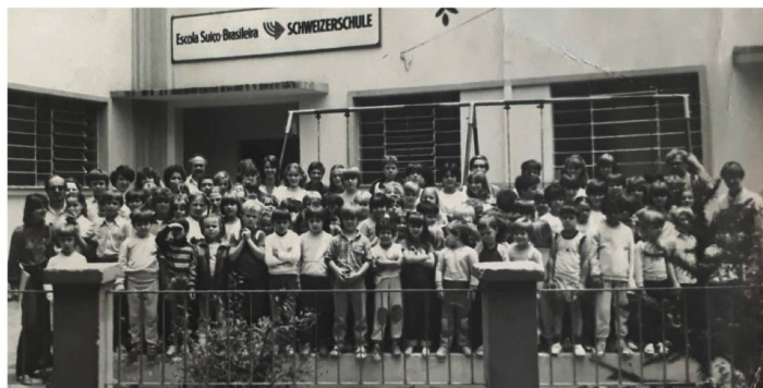
Os primeiros alunos e professores do colégio

do colégio, o que fez com que muitos suíços retornassem ao seu país de origem, diminuindo então o número de crianças matriculadas. O Colégio Suíço-Brasileiro de Curitiba fez dessa ocasião uma virtude e logo se transformou em uma escola de encontro multicultural e passou a desenvolver um trabalho pioneiro, visto pelas mais altas autoridades de Curitiba como um enriquecimento cultural e educacional.