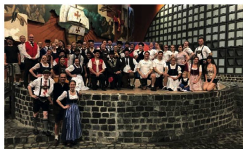
Grupo Folclórico

A paixão pela dança já trouxe Mugwyler ao redor do mundo com vários grupos folclóricos e lhe proporciona, segundo ele, muitos contatos, aprendizados e um olhar diferente à região e às pessoas locais. Em outras palavras: Integração suíço-brasileira através da dança!