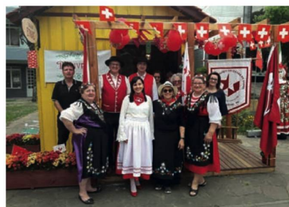
Grupo com trajes suíços

Com o lema DAS ORIGENS AO SONHO, a Prefeitura de Carlos Barbosa, através da Secretaria de Turismo, projetou uma casinha e a colocou bem no coração da cidade, no Parque da Estação. Foi nesta bela casa onde, a cada sábado