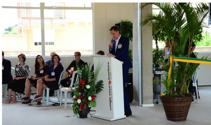
Cerimônia de abertura