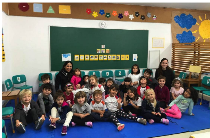
Alunos de Educação Infantil

O Jardim I é o primeiro ano da Educação Infantil. É a base estrutural do aluno dentro da escola. É quando terá o primeiro contato com a instituição e com os princípios e conceitos que regem o nosso ambiente escolar. Trata-se de uma importante fase, na qual o aluno começa a criar vínculos e desenvolver o prazer de vir à escola.