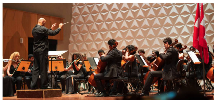
Orquestra Sinfônica Jovem do Rio de Janeiro

Esperamos que as relações entre a Suíça e o Brasil se fortaleçam cada vez mais!