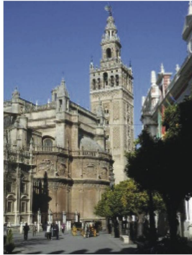
Sevilla mit ihrer Giraldla ist immer eine Reise wert. Séville et sa Giralda valent toujours le détour!