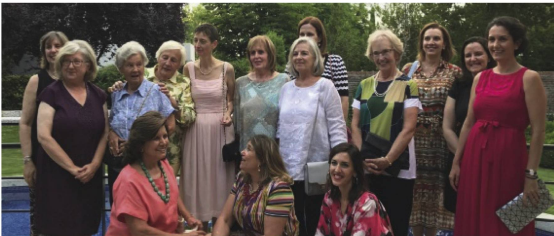
Gruppenfoto der Damas Suizas in der Residenz des Schweizer Botschafters in Madrid.

Cette association à but non lucratif a été fondée au milieu du siècle dernier, après la guerre civile espagnole et au milieu de la Seconde Guerre mondiale. À cette époque, la communauté suisse était alors assez nombreuse à Madrid et commença à confectionner des vêtements pour