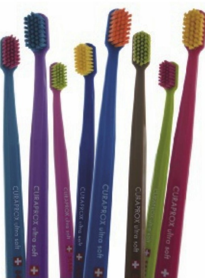
Die «swiss made» Zahnbürste Curaprox CS 5460 ultra, die man jetzt auch in Spanien und Portugal kaufen kann.