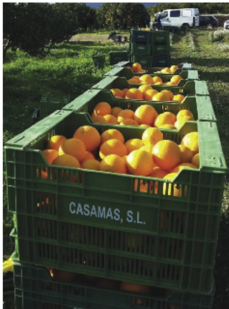
Rund 400 Tonnen Sonnenfrüchte gehen pro Saison in die Schweizer Haushalte

Während diesen Wintermonaten in der Schweiz zählt Boris die Tage bis er wieder auf seiner Finca sein kann, wo er derzeit daran ist die alten Gebäude zu restaurieren.