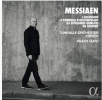
PAAVO JÄRVI: «Messiaen» Tonhalle-Orchester, Zürich Alpha 2019

Warum? Auf diese Frage hat Paavo Järvi nur gewartet. Genüsslich cool sagt der neue Chefdirigent des Tonhalle-Orchesters Zürich: «Weil ich Fan von Olivier Messiaen bin. Das ist grosse Musik, die viel zu wenig gespielt wird. Wir bringen nun eine kleine Sammlung von Meisterwerken auf CD heraus.»