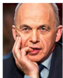
Bundespräsident Ueli Maurer: Muss für ein Rahmenabkommen eintreten, das seine Partei, die SVP, grundsätzlich in Frage stellt.