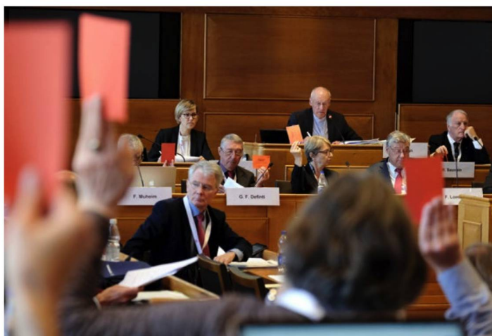
Vielseitiger Ratsbetrieb: In Bern stand für den ASR insbesondere das Wahljahr im Mittelpunkt.

Der ASR vermeidet aber in diesem wichtigen Thema den konfrontativen Kurs. Er verzichtet vorerst auf eine Klage gegen Postfinance. In seiner in Bern verabschiedeten Resolution nahm er aber klar Stellung: «Wir, die Auslandschweizerinnen und Auslandschweizer, verlangen einen diskriminierungsfreien Zugang zu den Leistungen von Postfinance.» (ASO)