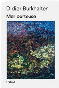
DIDIER BURKHALTER: «Mer porteuse». Editions de l'Aire, 2018, 194 Seiten CHF 24.00, Euro 24.00

«Mer porteuse», Didier Burkhalters drittes Werk, entstand am Neuenburgersee. Die poetische Prosa dreht sich um Abstammung und die Macht unserer familiären Wurzeln. Eine Hauptrolle in dieser Geschichte eines zurückgelassenen Kindes spielt der Atlantik, Symbol der Trennung, aber auch der Verbindung zwischen den Menschen. Der Altbundesrat schreibt mit geschliffener Feder, so etwa in der Passage, in der die Rauchwolken eines Ozeandampfers das Schiff mit dem Himmel verbindet, «als ob es sich fürchtete, von den Tiefen verschlungen zu werden». Der Schwachpunkt: eine gewisse Trägheit oder Schwülstigkeit in der Formulierung, welche die Indifferenz als