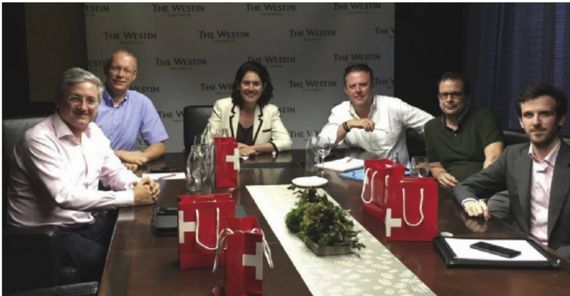
Die Honorarkonsulin bei einem Treffen mit Schweizer Unternehmern in Valencia