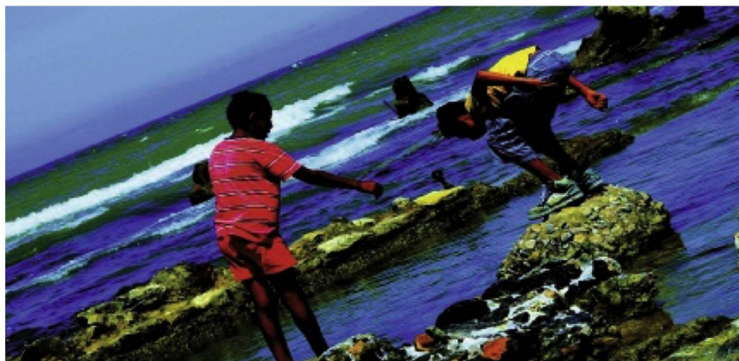
«Bildbuch» – ein Film von Jean-Luc Godard

Jean-Luc Godard setzt mit seinem neuesten Film sein sich alle Freiheiten nehmendes Spätwerk fort. Ein rauschhafter Gedankenfluss, eine assoziative Collage in fünf Kapiteln. Die Sehnsucht nach Freiheit, die Abgründe der Menschheit, die Schönheit des Kinos, Zeit und Geschichte, gedehnt und verdichtet. Kinostart deutschlandweit ab 4. April.