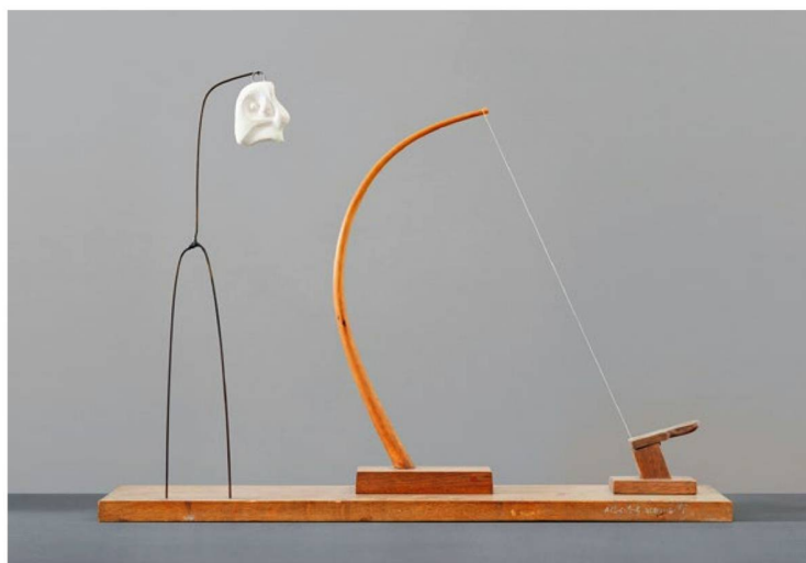
Alberto Giacometti Fleur en danger, 1932 Holz, Gips, Draht und Schnur