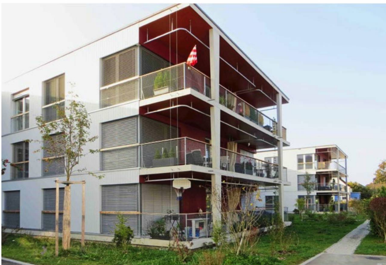
Die Siedlung Brüggläcker in Schwamendingen, erstellt von einer Wohnbaugenossenschaft, liegt in direkter Nachbarschaft zu einem traditionellen Einfamilienhaus-Quartier.