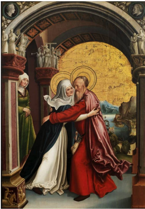
Niklaus Manuel: «Altar der heiligen Anna: Begegnung von Joachim und Anna an der Goldenen Pforte», 1515.