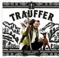
TRAUFFER: «Schnupf, Schnaps + Edelwyss», Ariola/Sony, 2018.

Es beginnt mit einem Alpaufzug, man hört das Stapfen der Kühe, ein gelegentliches Muhen und vereinzelte Glocken. Dann setzt ein hymnisches Jodeln ein, das keinen Zweifel daran lässt, wo für Trauffer der Himmel ist: hoch oben in den Bergen, in der Bilderbuch-Schweiz. Dort also, wo es Sex, Drugs and Rock'n'Roll nie geschafft haben, «Schnupf, Schnaps + Edelwyss» – so der Titel des neuen Albums des Berner Erfolgsmusikers – zu verdrängen.