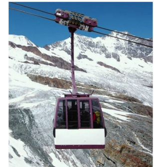
Auch diese Bahn steht für besondere Innovation: Die weltweit erste Luftseilbahn an drei Seilen schwebt seit 1991 in Saas Fee den Berg hoch.