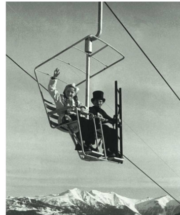
Diese beiden «Glücksbringer» eröffneten die erste kuppelbare Sesselbahn der Welt am 16. Dezember 1945 in Flims.