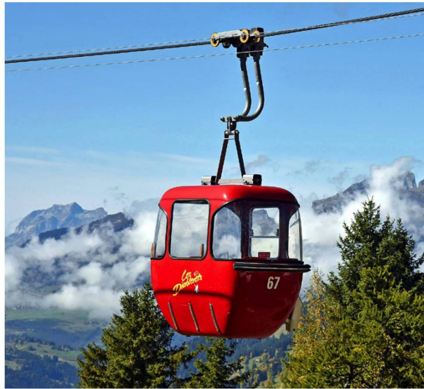
Die knallroten Giovanota-Gondeln von Les Diablerets aus den 70er-Jahren waren bis April 2017 in Betrieb. Die Konzession wurde nicht mehr erneuert, aber eine Ersatzbahn ist geplant.