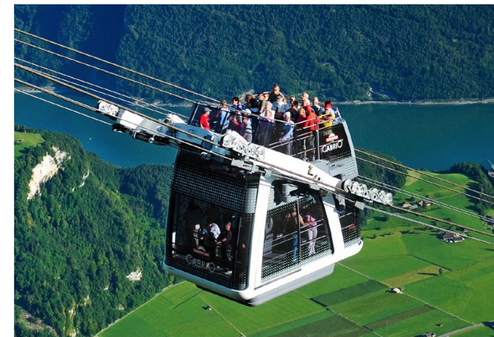
Eine Weltneuheit mit Baujahr 2012: ein Cabrio am Nidwaldischen Stanserhorn.