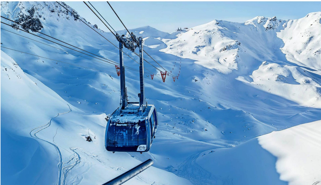
Die Urdenbahn in Arosa und Lenzerheide ist die schnellste Seilbahn der Schweiz. Die stützenlose Pendelbahn verbindet seit 2014 zwei Skigebiete, ohne neue Skipisten erschliessen zu müssen.