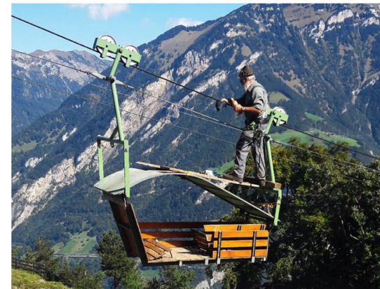
Für viele Familien und Alpbetriebe in der Innerschweiz sind Kleinseilbahnen ein Lebensnerv – wie etwa die seit 1979 fahrende Bärchibahn bei Isenthal.